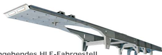
Durchgehendes HLE-Fahrgestell Kein Durchbiegen des Chassis im Türöffnungsbereich.