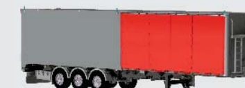
Türen mit 6,20 M VORNE rechts oder links