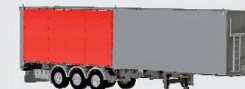
Türen mit 2 x 6,20 M HINTEN rechts oder links