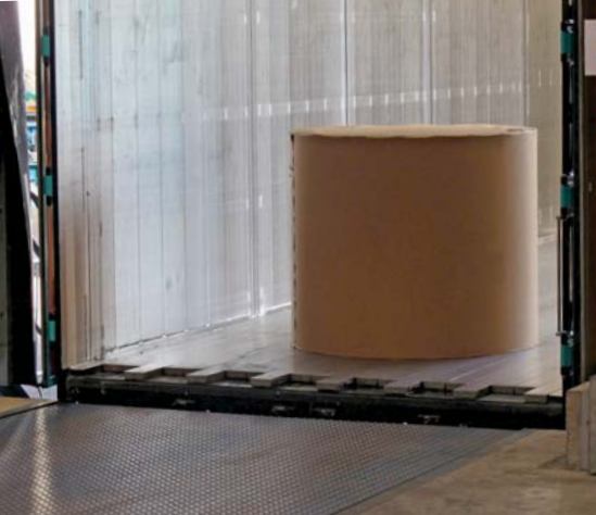
Schubbodenprofil glatt für den Transport von Papierrollen.

«Beladen / Entladen beidseitig, von oben, von hinten... »