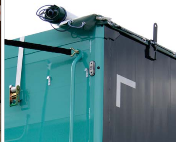
Dachrollplane und umklappbare Planenstopper mit Rückholfeder.