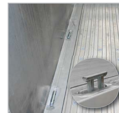
04 - Zurr-Anker versenkbar (TÜV-Cert.).