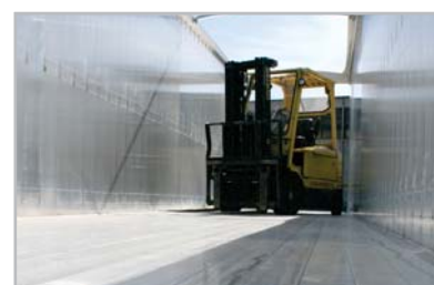
Boden befahrbar. Legras-Böden sind absolut Gabelstaplerbefahrbar bis 9 to.