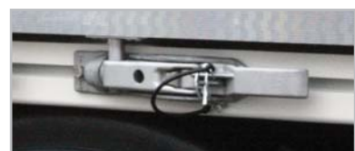
05 - Stabiler Türverschluss.