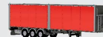
Türen mit 2 x 6,20 M rechts oder links