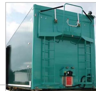
03 - Vorderwand mit Laufbühne.