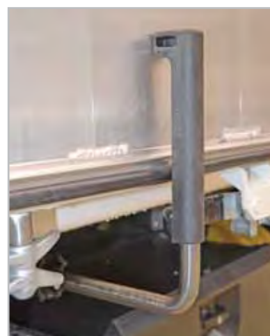
01 - Door restraint New reinforced inox door restraint.