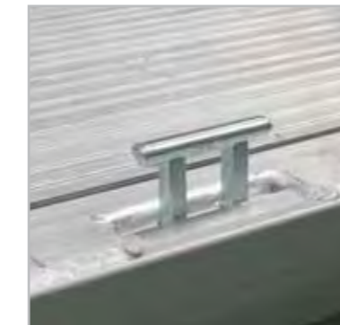
Zur-Ösen TÜV zertifiziert.