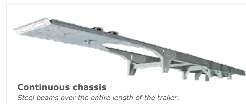
Continuous chassis Steel beams over the entire length of the trailer.