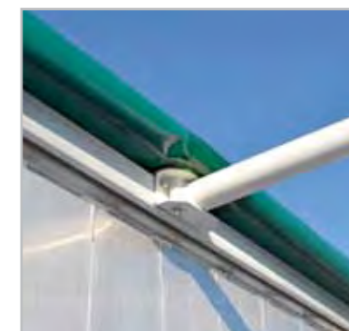
04 - Tie bars Reinforced tie bars option.