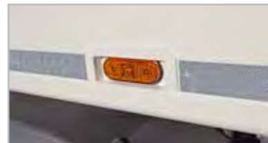
02 - Erste Begrenzungs Lampe integriert.