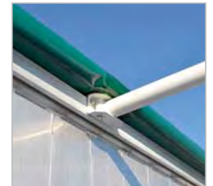
2 Querspiegel Ø 80 mm.