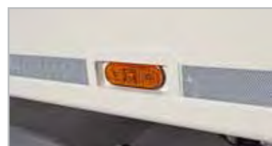
02 - Front side lights Lights Recessed in the body.