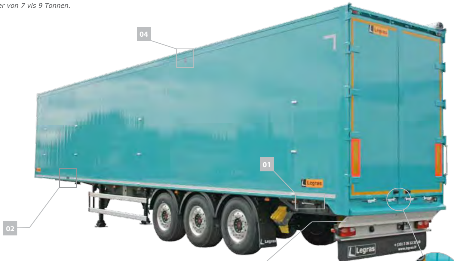
Aluminium Klappe als Lampenschutz.