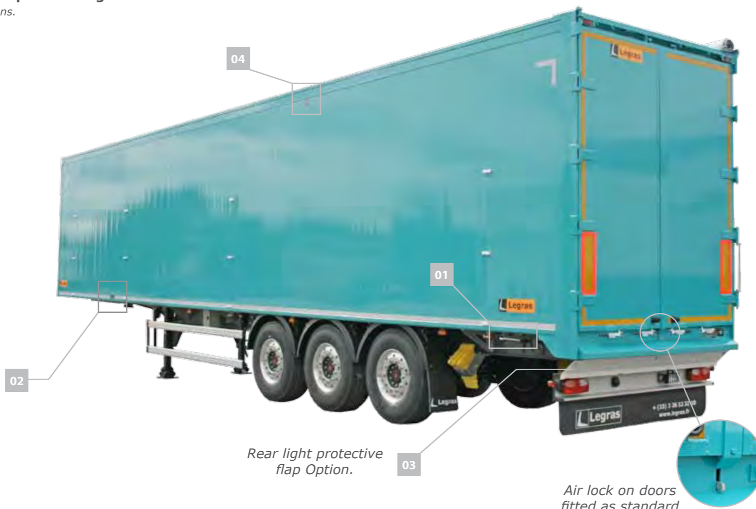
03 Rear light protective flap Option.