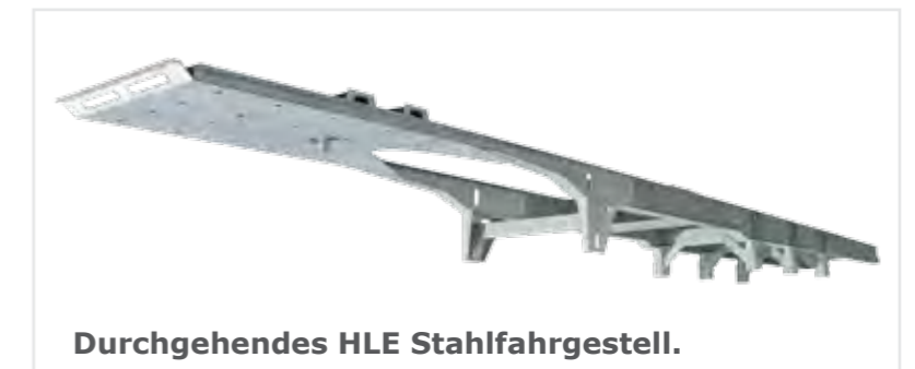
Durchgehendes HLE Stahl Fahrgestell.