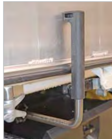
01 - Türfeststeller in Edelstahl.